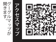
アクセスマップ グーグルマップが 開きます