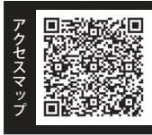
アクセスマップ グーグルマップが 開きます。