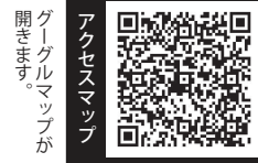
グーグルマップが 開きます。