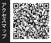
Googleマップが 開きます。

アフターサービス保証付 お引渡し後の不具合・故障に対して 保証制度を導入しております。