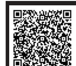
アクセスマップ ケーグルマップが開きます。