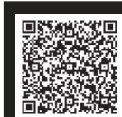
アクセスマップ Googleマップが開きます。