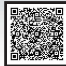
アクセスマップ グーグルマップが開きます。