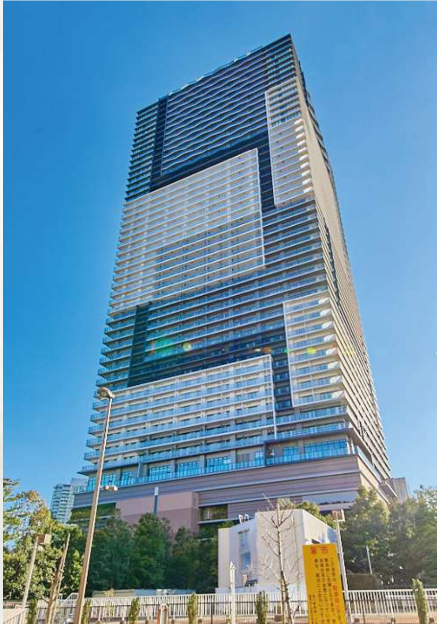
ブルンズタワー豊洲